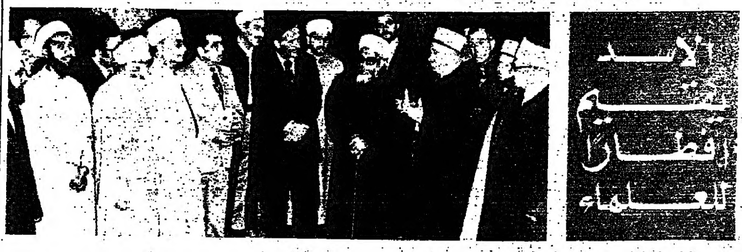
اتلم الرئيس حافظ الأسد برفقة اقطار العلماء في حفلة قصر الرئاسة في المهجرين حضرها اللواء عبد الرحمن خديوي رئيس مجلس الوزراء والسيد اديب مكرم وزير الدولة لشؤون رئاسة الجمهورية والاستاذ عبد المنذر السيد وزير الثقافة واللواء زكي نزال وزير التعليم العالي والبحث العلمي

مطردة السحرة: رأيتها بالتحقيقات: الحكومة تشن حملة مطاردة ضد السحرة، والجملة ليست موجبة ضد شخصيا وصاحب، ولكن اعتقد ان هذا الرئيس هو القضاء على حزب المؤتمر، وهذا يعني القضاء على اي شيء يمكن ان يشكل معارضة. المؤتمر هو المعارضة الوحيدة، والتركي على انهم يعتقدون بانني قادرة على تحريك المؤتمر. رأيتها بالتحكم الهندية: بعدما اعطت الحكومة المركزية الحكم الهندية بدأت الولايات بتنهجها وربما حدثت بعض التجاوزات. لم ايقاف شخصي ربما لم يكن من الواجب توقيفهم. ونشر بعض الناس في وسائل الاعلام ان كان الموضوع استبداديا، ولكن كان يتوجب القيام بشيء سيا